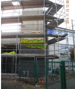
Erweiterung Halle, Osnabrück – Verblendarbeiten

Wir freuen uns auf die gute, faire und langfristige Zusammenarbeit mit Ihnen, bzw. möchten wir auch Sie als zufriedenen Kunden für uns gewinnen.