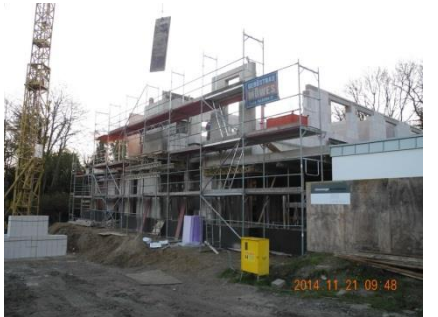
Neubau Wohnhaus, Osnabrück – Mauerarbeiten