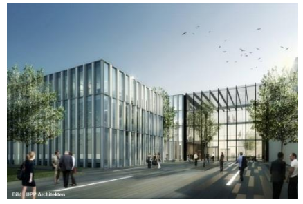
Neubau Verwaltungsgebäude, Beckum – Rohbauarbeiten inkl. Bewehrung