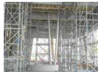
Neubau Schwimmbad, Ostsee, Rohbauarbeiten komplett