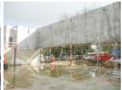
Sporthalle, Osnabrück, Rohbauarbeiten komplett