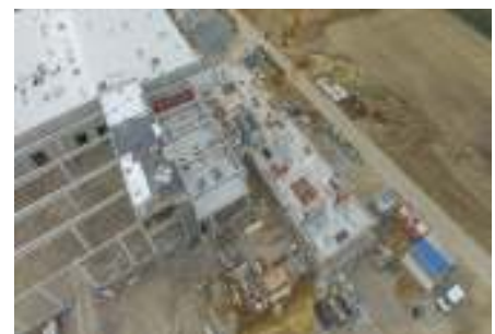
Erw. Lagerhalle, Werther, Schalungs-, Betonarbeiten