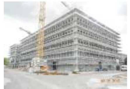
Neubau Verwaltungsgeb. Leipzig, Schalungs-, Beton und Fertigteilarbeiten