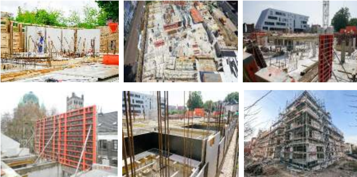
Neubau Wohnanlage mit Tiefgarage, Neuss, Rohbauarbeiten komplett