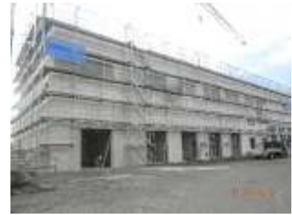
Neubau S.Becken Hannover, Rohbauarbeiten komplett