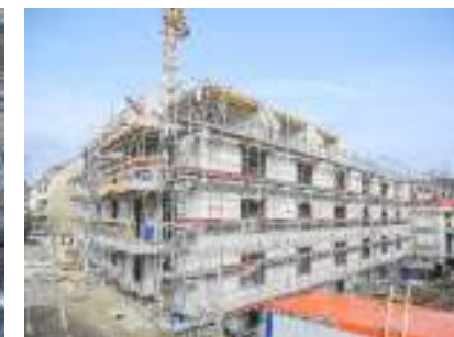
NB Seniorenpflegeheim, Hannover Maurer-,Schal-,Beton-,Fertigteilarbeiten