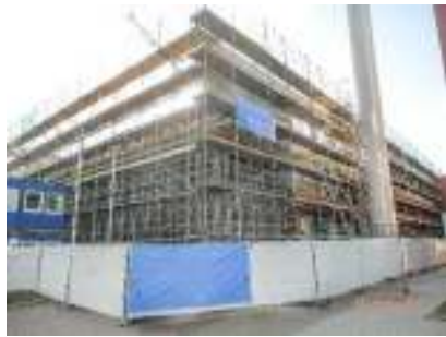
Neubau und Erweiterung Klinikgebäude, Osnabrück, Rohbauarbeiten komplett