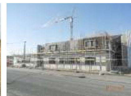
NB Büro- u. Produktionsgeb. Köln, Schal-, und Betonarbeiten