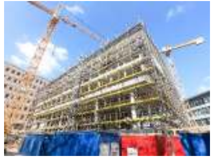
3-geschoss.TG und Klinikgebäude, Münster Rohbauarbeiten komplett