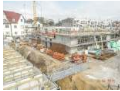
Neubau Wohnanlage, Düren, Rohbauarbeiten komplett