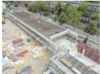
Verwaltungsgebäude, Köln, Rohbauarbeiten komplett