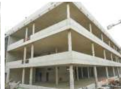
Neubau Forschungsgebäude, Köln Schal-, Betonarbeiten