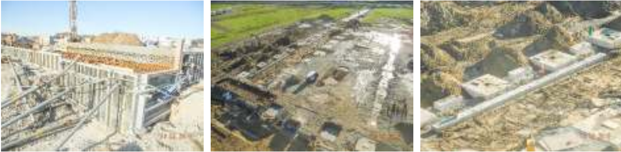
Logistikzentrum Halle, Schal-, und Betonarbeiten