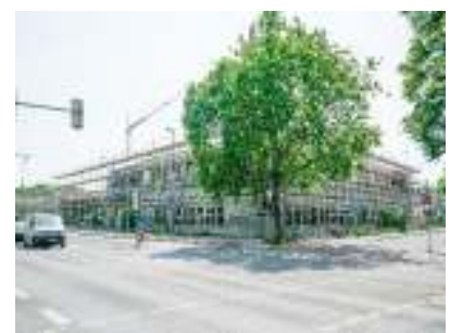
Feuerwehr NRW, Rohbauarbeiten komplett